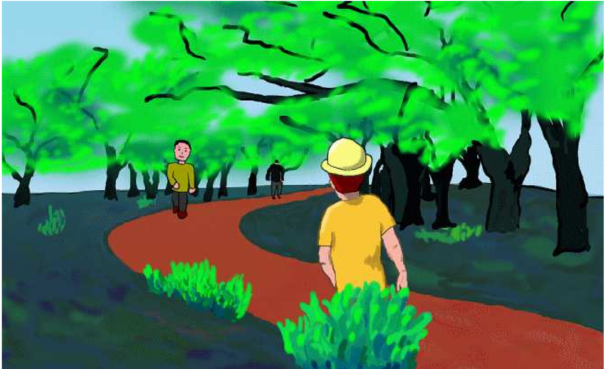
黄色い帽子をかぶった男の人が、田舎道をのんびりと散歩中です。