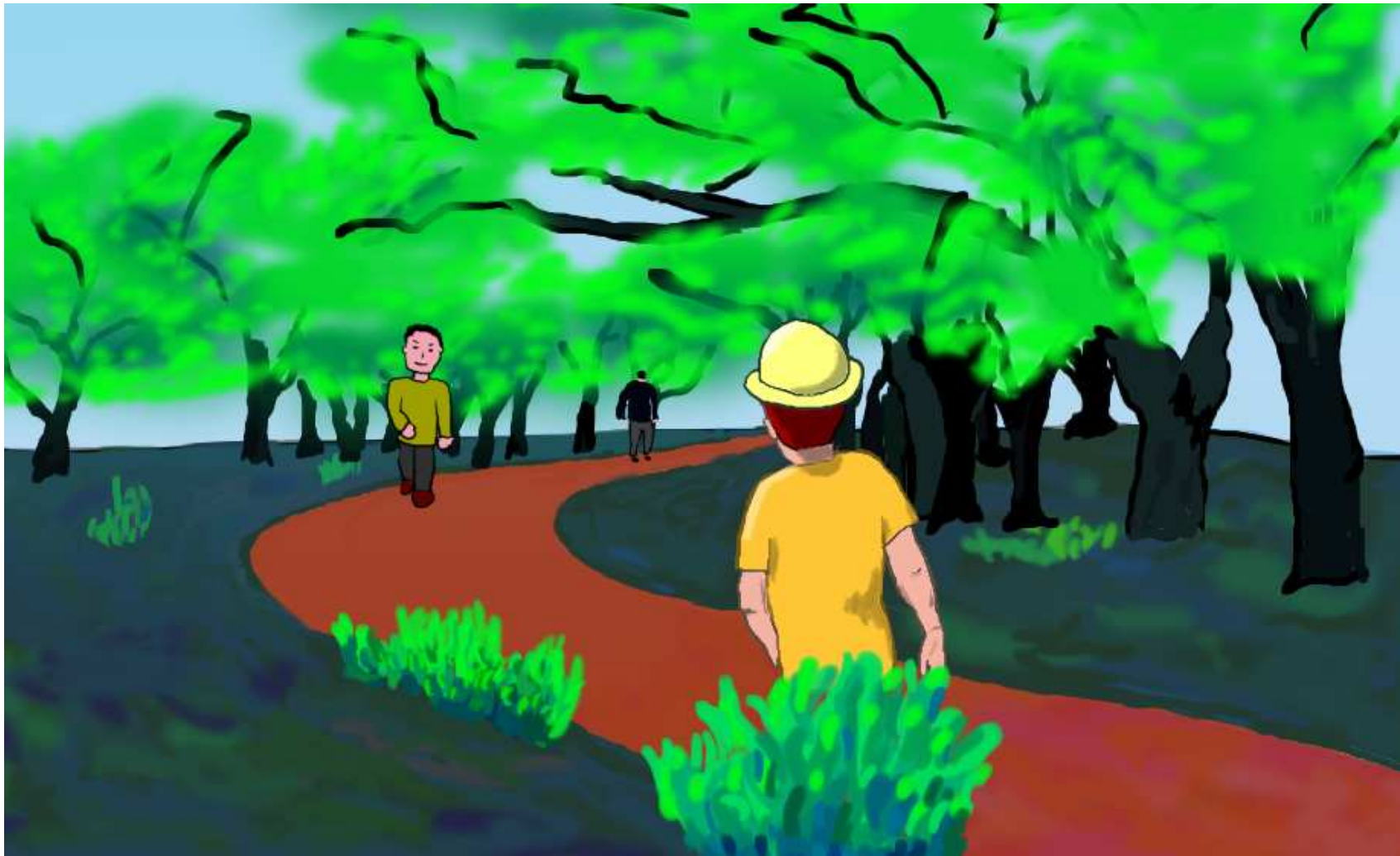
黄色い帽子をかぶった男の人が、田舎道をのんびりと散歩中です。